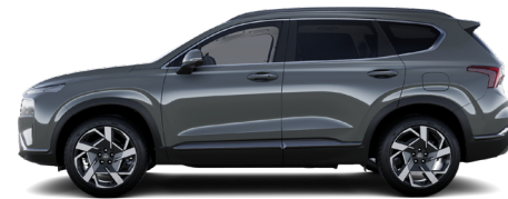
Magnetic Gray Metallic