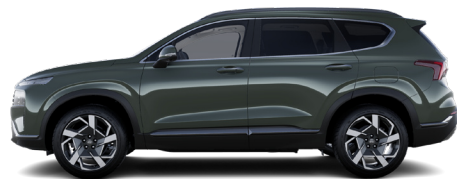
Forest Gray Metallic