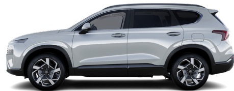
Glacier White Metallic