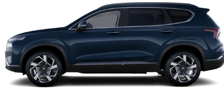
Lagoon Blue Pearl