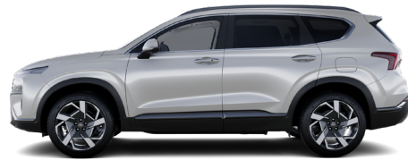
Typhoon Silver Metallic