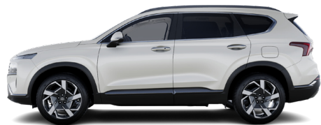
Creamy White Pearl