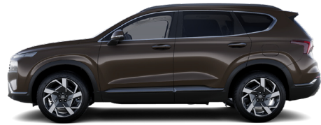
Taiga Brown Pearl